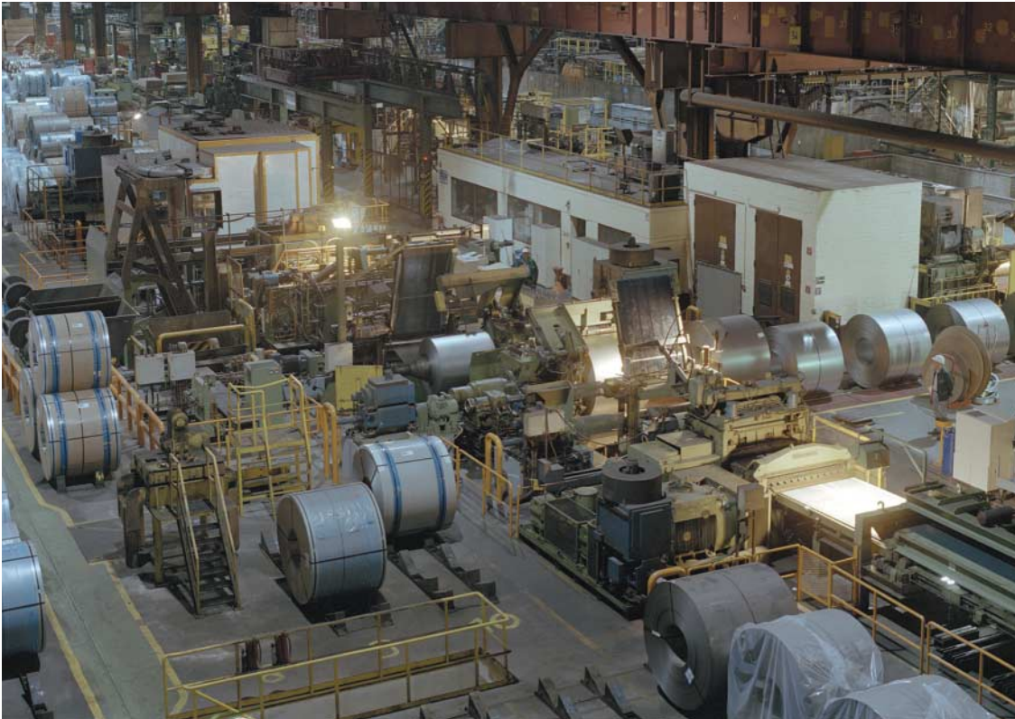
3 Kaltwalzwerk der ThyssenKrupp Steel AG in Bochum Cold rolling mill of TKS in Bochum

dennoch eine manuelle Arbeit mit der Anwendung nebst ausgereifter Analysefähigkeiten und guter Visualisierung verfügbar sein. Da die Warmband-Kaltband-Kombination unverändert separat vor der Reihenfolgebildung für die Beizen platziert bleiben sollte und die Anlagenversorgung in guten wie in kritischeren Vormaterialsituationen zu gewährleisten ist, war eine besondere spezifizierte Fähigkeit die situative Anwendung des Regelwerkes, vgl. Regeltypen in Bild 5.