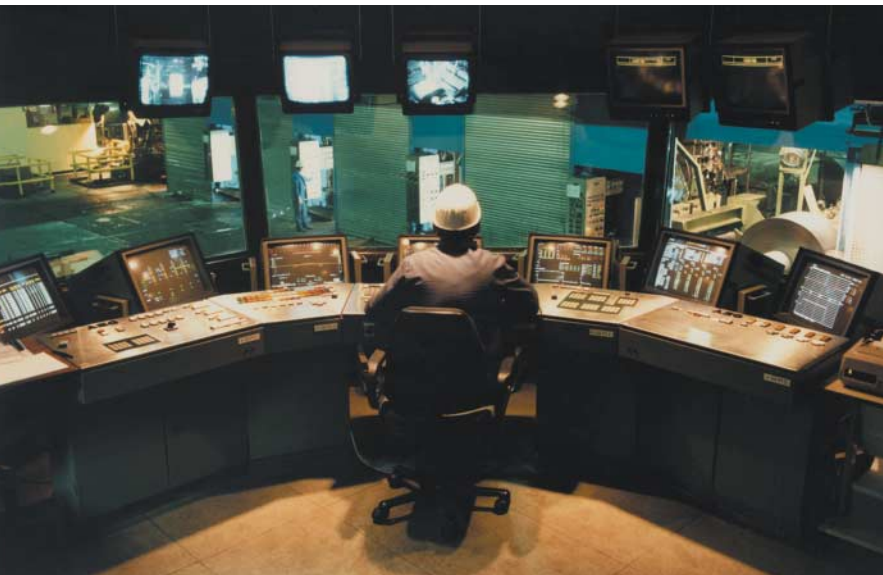
4 Kaltwalzwerk der ThyssenKrupp Steel AG in Dortmund Cold rolling mill of TKS in Dortmund

Berücksichtigt werden hier sämtliche seitens ThyssenKrupp Steel spezifizierten Einflussgrößen. Die benötigte Laufzeit des Algorithmus zur Ermittlung opti-