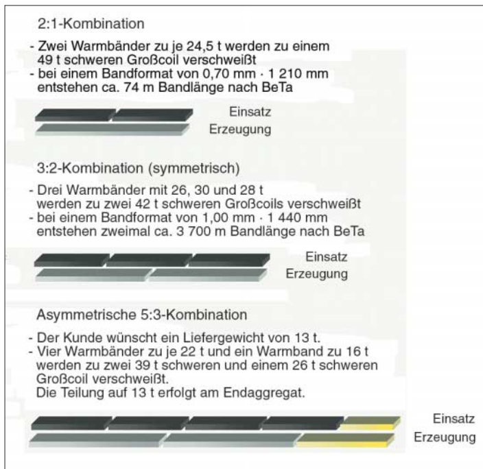
2 Einige Beispiele von Großcoils an der BeTa im Kaltwalzwerk Dortmund (195 000 t/Monat) und der nachgeschalteten Contiglühe (63 000 t/Monat) mit Einsatzcoilgewichten bis zu 50 t

Ein kleines, den Standort Bochum und Dortmund vertretendes Projektteam spezifizierte die Regeldetails in Form einer strukturierten Regeltypkette, Bild 5, und stellte eine systemunterstützte Arbeitsmethodik als Maximallösung zusammen. Die Fähigkeiten der angestrebten Softwarelösung sollten neben einfacher, flexibler Konfiguration der Datenanbindung, Datenvisualisierung und vorhandener Regeln unbedingt einen fähigen und anwenderverständlichen Algorithmus enthalten. Trotz eines hohen Automatisierungsgrades (80 % sollen die Anwendung ohne manuellen Korrekturbedarf durchlaufen) sollte